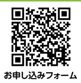
お申し込みフォーム